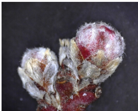
Εικόνα 1. Έναρξη του σταδίου C