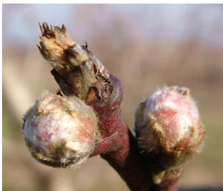
έναρξη C (οριακά) Εμφάνιση κάλυκα