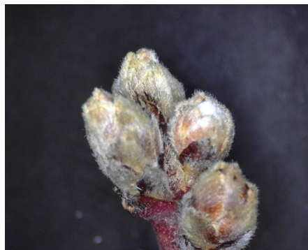
Εικόνα 2. Διόγκωσης των οφθαλμών