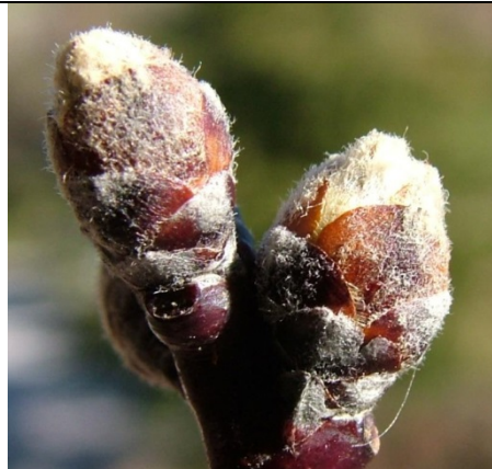
B (ιδανικό) Διόγκωση οφθαλμών