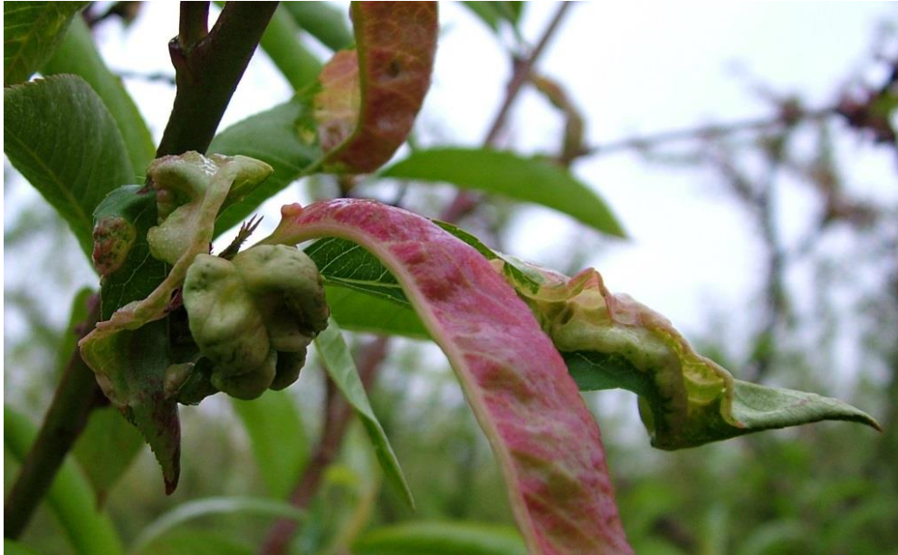
Προσβολή από Εξώασκο. Καρούλιασμα ολόκληρου του φύλλου προς τα κάτω ή μόνο του βασικού μέρους, κόκκινος μεταχρωματισμός του ελάσματος.

Ο Προϊστάμενος του Π.Κ.Π.Φ.Π. & Φ.Ε. Θεσσαλονίκης