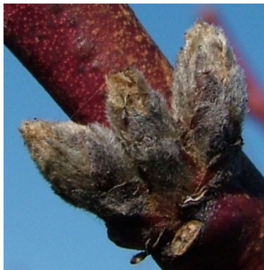
A (νωρίς) Κοιμώμενος οφθαλμός