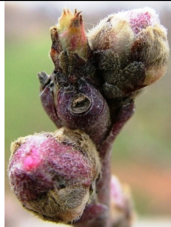
C (αργά) το πρώτο φύλλο προβάλλει ανάμεσα στα λέπια και φαίνεται από πλάγια