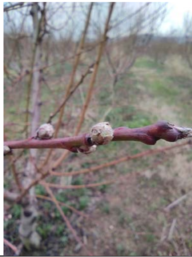
Ποικιλίες στην Ημαθία