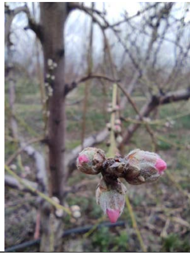
Πρώιμες ποικιλίες στην Πέλλα