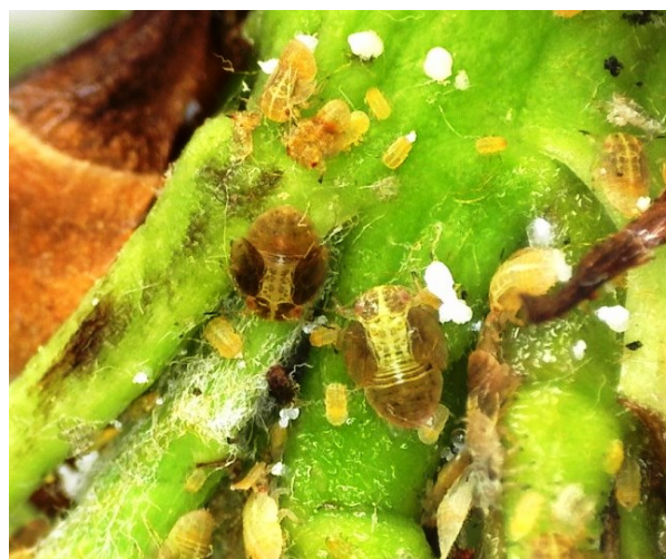
Εικόνα. Αυγά και προνύμφες Cacopsylla pyri σε ταξιανθίες