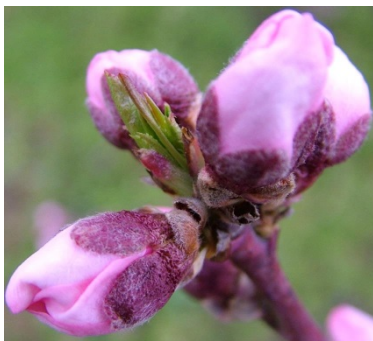
D Εμφάνιση στεφάνης