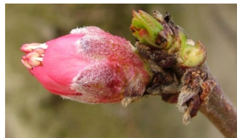
E Εμφάνιση στημόνων