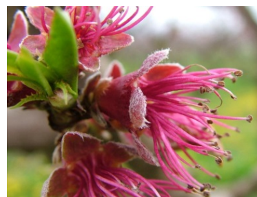
G Πτώση πετάλων