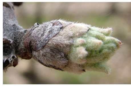
C 3 "αυτιά ποντικού" πράσινες κορυφές φύλλων εξέχουν από τα λέπια