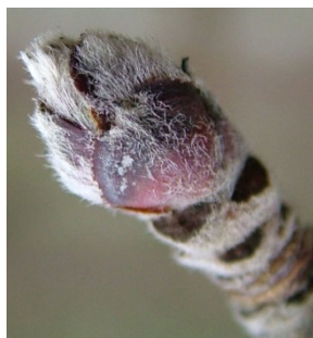
B Φούσκωμα οφθαλμών, διαχωρισμός λεπιών