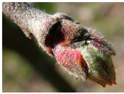
C Πράσινη κορυφή