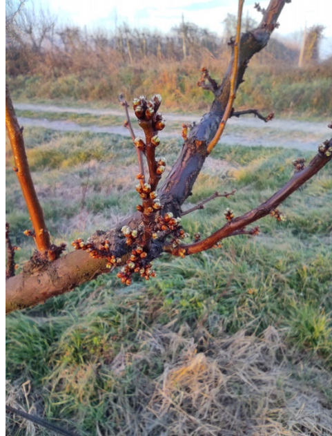
Πρώιμες ποικιλίες στην Ημαθία