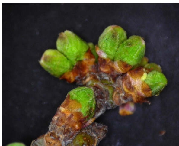
Πράσινη κορυφή Δαμασκηνιά στάδιο C