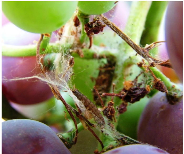
Εικόνα 2. Αυγά και προνυμφική δραστηριότητα Ευδεμίδας