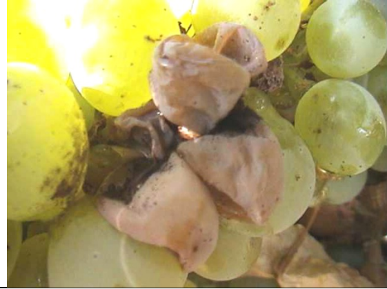
Εικόνα 1. Άμεση βλάβη των ραγών από Ευδεμίδα και έμμεση βλάβη από Βοτρίτη