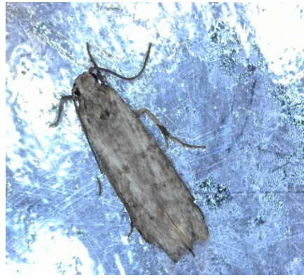
Πυρηνοτρήτης ( Prays oleae )