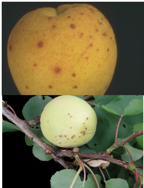
Εικόνα 2. Προσβολή από Κορύνεο σε φύλλα και καρπούς Βερικοκίας