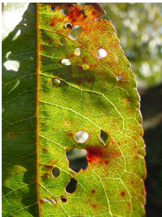
Εικόνα 1. στάδια ΒΕΡΙΚΟΚΙΑΣ