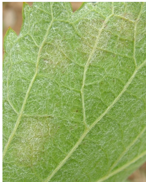
Επάνθιση (καρποφορία του μύκητα) στην κάτω επιφάνεια του φύλλου