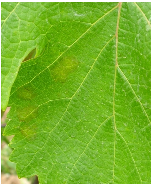
Κηλίδες λαδιού στην πάνω επιφάνεια του φύλλου