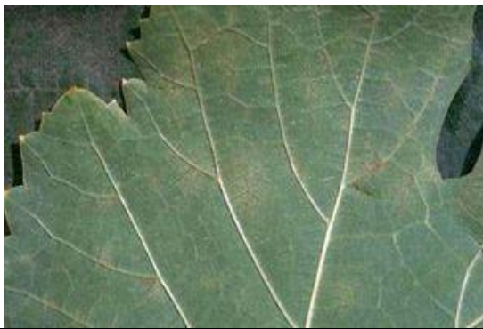
Ίχνη (ελάχιστες κηλίδες προσβολής ή κανένα σύμπτωμα, ούτε μυκήλιο ούτε ορατή καρποφορία του μύκητα, μόνο ένα μικρό κατσάρωμα του ελάσματος)