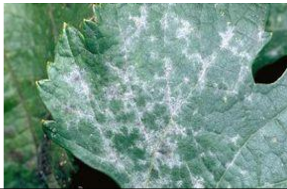
Μέτρια (εμφανείς αρκετές κηλίδες προσβολής, συνήθως περιορισμένες σε διάμετρο 2-5 εκατ)