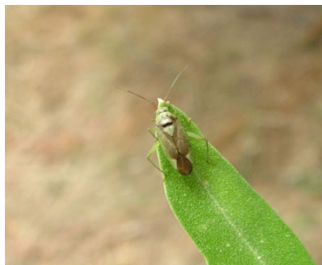
ΚΑΛΟΚΟΡΗ ( Calocoris trivialis )