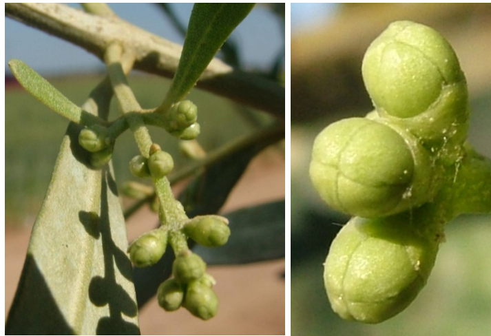
στάδιο Ε Διαφοροποίηση στεφάνης