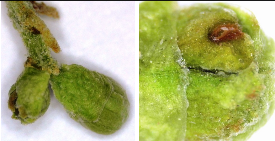
προσβολή και βλάβη από ακάρεα Eriophyidae