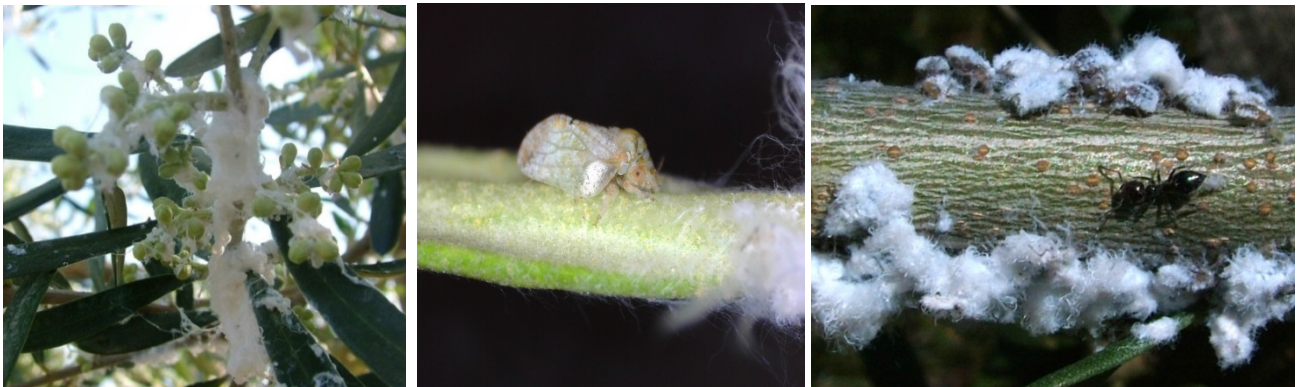
ΒΑΜΒΑΚΑΔΑ ( Euphyllura phillyreae )