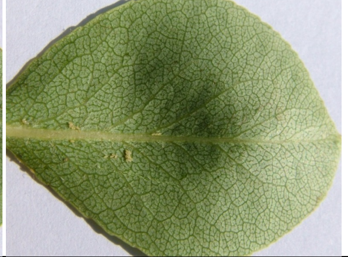
Αυγά και προνύμφες Cacopsylla pyri όπως φαίνονται με γυμνό μάτι