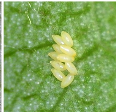
Αυγά νέα-λευκά, αυγά ώριμα-κίτρινα και προνύμφη που εκκολάπτεται όπως φαίνονται από μεγέθυνση

Ο Προϊστάμενος του Π.Κ.Π.Φ.Π. & Φ.Ε. Θεσσαλονίκης