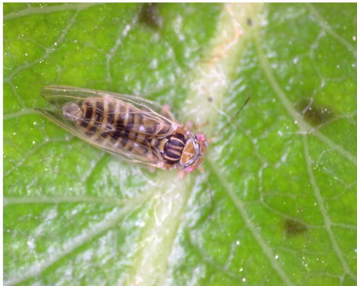
Τέλειο έντομο Cacopsylla pyri της ανοιξιάτικης πτήσης