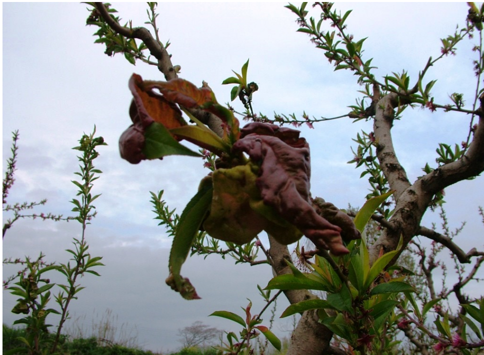
Εξώασκος – Καρούλιασμα φύλλου