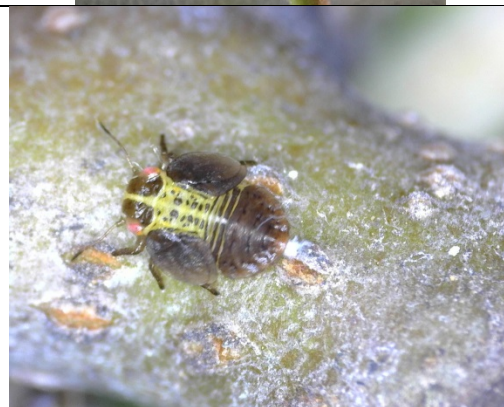
Προνύμφες τελευταίων σταδίων