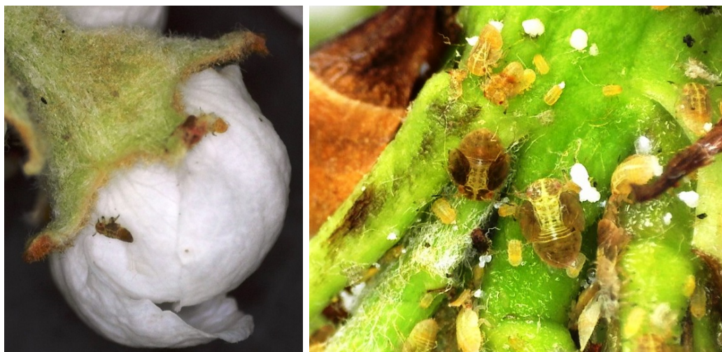
Αυγά και προνύμφες Cacopsylla pyri σε ταξιανθίες